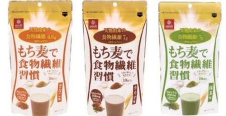
もち麦で食物繊維習慣 きなこ味/カカオ味/抹茶味