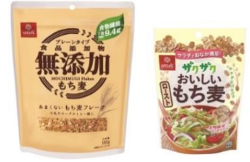
あまくない もち麦フレーク ザクザクおいしい ローストもち麦