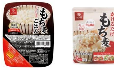
もち麦ごはん 無菌パック かけるだけもち麦