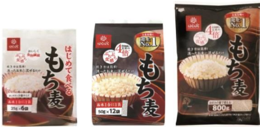
はじめて 食べるもち麦 もち麦 スタンドパック もち麦 800g