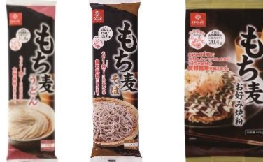
もち麦 うどん もち麦 そば もち麦 お好み焼粉