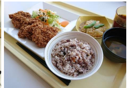
<社員食堂のごはん選択風景(もち麦ごはん、十六穀ごはん)> <社員食堂とある日のメニュー写真(十六穀ごはん)>