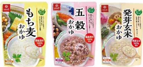
もち麦おかゆ/五穀おかゆ/発芽玄米おかゆ