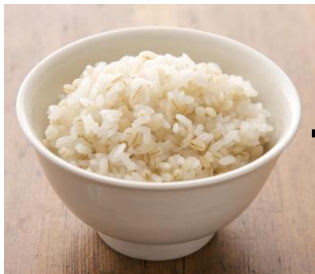
大麦に含まれる 【水溶性・不溶性のWの食物繊維】