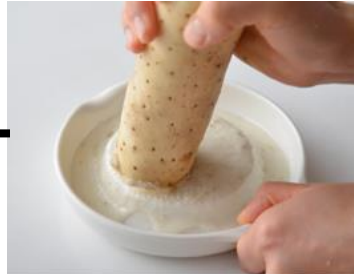
山芋に含まれる 【粘り成分】