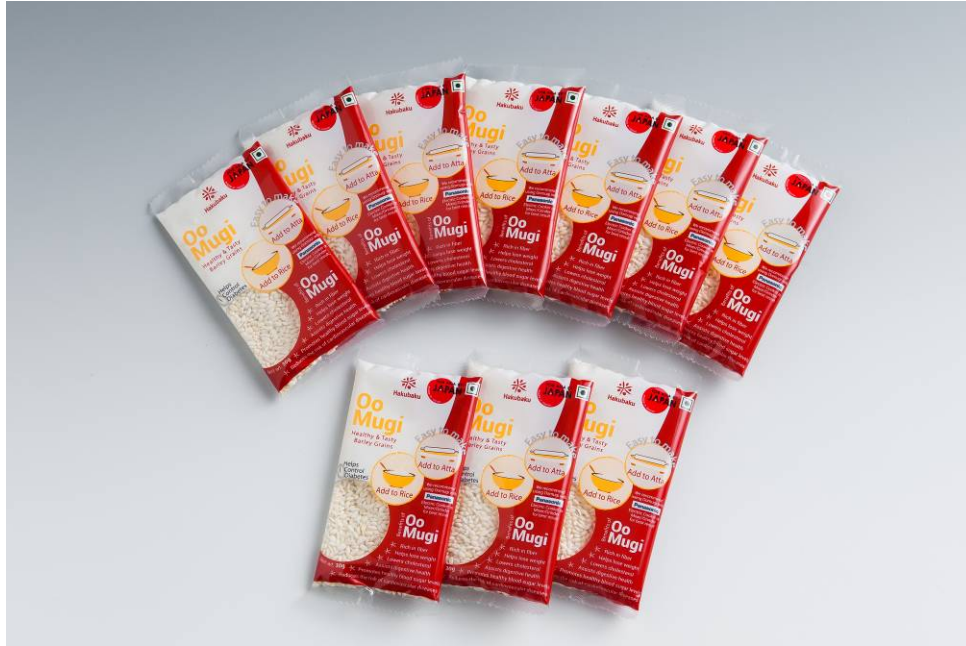
30g 入りインド向け大麦商品「OoMugi」